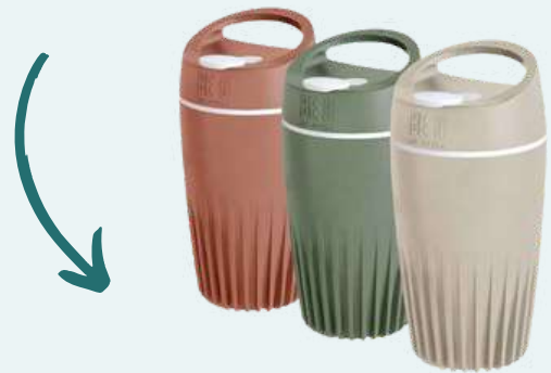
BE O BOTTLE COFFEE CUP

De BE O cup is een herbruikbare koffie/theebeker gemaakt van planten, namelijk van gebruikte, plantaardige oliën! Dit materiaal is hernieuwbaar en bespaart CO2.