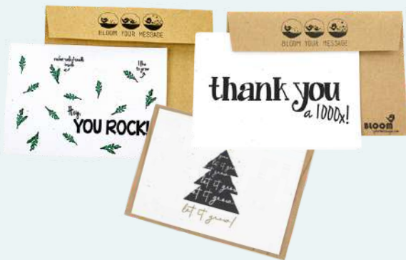
Kaarten met bloeizaadjes van Bloom your Message

De BE O cup is een herbruikbare koffie/theebeker gemaakt van planten, namelijk van gebruikte, plantaardige oliën! Dit materiaal is hernieuwbaar en bespaart CO2.