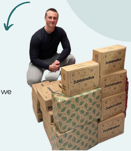
CadeauBox van karton